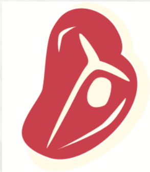
Carne 6 dias